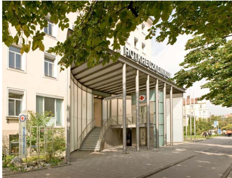
Standort Nymphenburger Straße