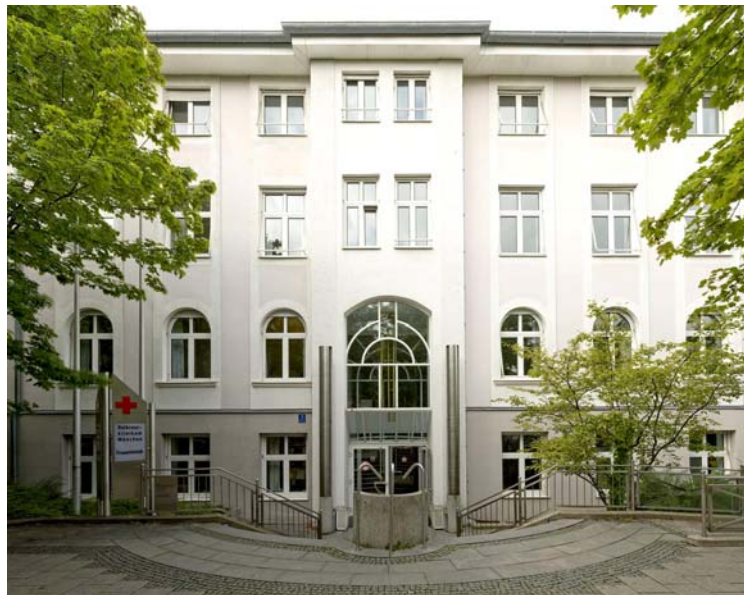
Standort Taxisstraße (Frauenklinik)